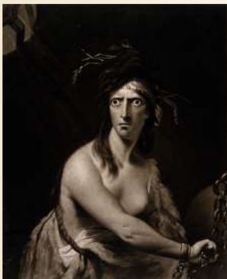
Una donna seminuda con occhi fissi esagerati e polsi incatenati che rappresentano la follia. Mezzatinta di W. Dickinson, 1775, dopo R. Pine.